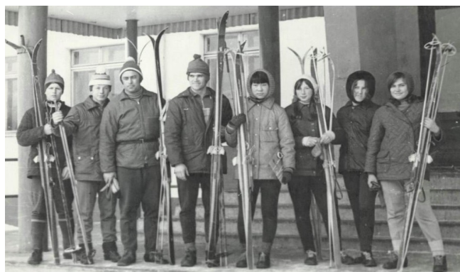
1973г. Сборная команда Анивской средней школы №2

14. Баламутина, Л. Многие ему благодарны / Л. Баламутина // Утро Родины. – 1996. – 13 марта.