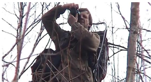
Весна наблюдение за перелётными птицами. 2020 г.