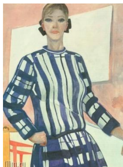
Александр Дейнека. Юный конструктор

[«Юный конструктор»]. – С. 210–212 ; [«Мать»]. – С. 250–252.