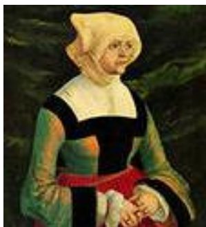
Альбрехт Альтдорфер. Портрет молодой женщины

24. Долгополов, И. Питер Пауль Рубенс [1577–1640]. «Портрет камеристки» // Мастера и шедевры. В 3 т. Т. 1 / И. Долгополов. – М. : Изобраз. искусство, 1986. – С. 221–246 : ил.