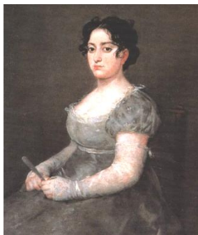
Франсиско Гойя. Женщина с веером

29. Белошапкина, Я. Женские образы [Франсиско Гойя: 1746–1828] / Я. Белошапкина // Искусство. — 2008. — № 4. — С. 10-11 : ил.