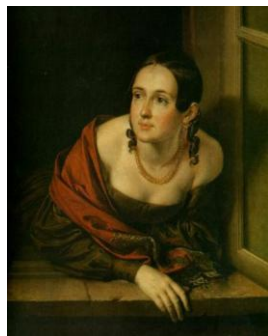
Василий Тропинин. Девушка на балконе

43. Долгополов, И. Алексей Венецианов [1780-1847] // Мастера и шедевры. В 3 т. Т. 2 / И. Долгополов. – М. : Изобраз. искусство, 1987. – С. 108–129 : ил.