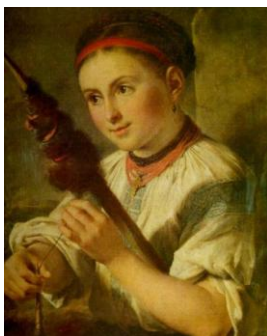
Василий Тропинин. Пряха