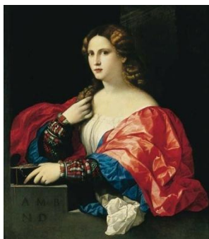
Пальма иль Веккио. Красавица

[Пальма иль Веккио (1480–1528). Красавица]. – С. 682–684 ; [Альбрехт Альтдорфер (1480–1538). Портрет молодой женщины]. – С. 690–694.