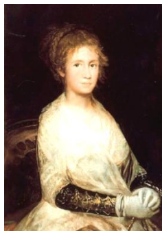
Франсиско Гойя. Портрет жены

30. Долгополов, И. Франсиско Гойя [1746–1828]. «Портрет актрисы Антони Сарате» // Мастера и шедевры. В 3 т. Т. 1 / И. Долгополов. — М. : Изобраз. искусство, 1986. — С. 327–334 : ил.